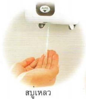
สบู่เหลว