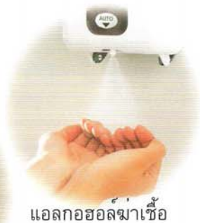
แอลกอฮอล์ฆ่าเชื้อ