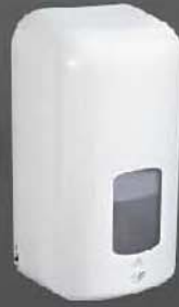
WF-068H ขนาด 300 มล. พ่นน้ำยาเป็นหยด

ใช้ได้กับสบู่เหลวล้างมือ น้ำยาฆ่าเชื้อโรคและแอลกอฮอล์ เจลได้ทุกชนิด โดยสามารถพ่นสเปรย์น้ำยาเป็นพวย หรือเป็นหยดได้ตามต้องการ