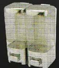
SSV8502 ขนาด 600 มล. X2