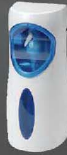
HV-5606 ขนาด 1,000 มล.สามารถพ่น น้ำยาเป็นพวยหรือเป็นหยด (ระบุตอนสั่งซื้อ)