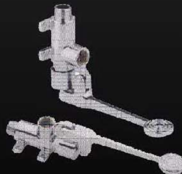
MTE-101 (ก๊อกน้ำแบบเท้าเหยียบ)