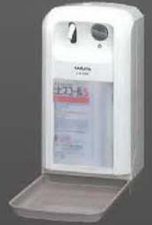
SAUD-1000 ขนาด 1,000 มล. สามารถพ่น น้ำยาเป็นพวยหรือเป็นหยด (ระบุตอนสั่งซื้อ)