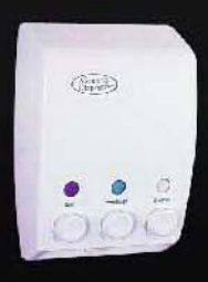
HP-103 ขนาด 600 มล. X3