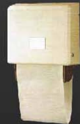
NTP-101 เครื่องจ่ายผ้าเช็ดมือ