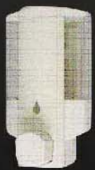
SSV6101 ขนาด 330 มล.