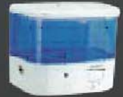
MVS101 ขนาด 600 มล.