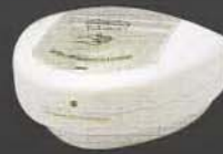
SSV222 ขนาด 300 มล.