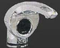
SATS-1000 ขนาด 1,000 มล.