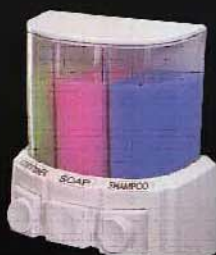
WF-006 ขนาด 400 มล. X3