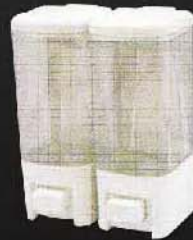
SSV8102 ขนาด 600 มล. X2