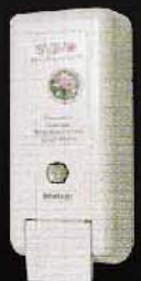
SSV2101 ขนาด 400 มล.