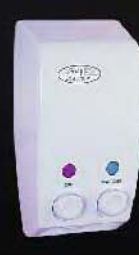
HP-102 ขนาด 600 มล. X2