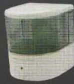
SSV221 ขนาด 600 มล.