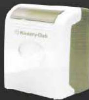
KCP-101 กระดาษเช็ดปาก POP-UP