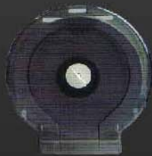
KQJ-101 กระดาษชำระจับมือ