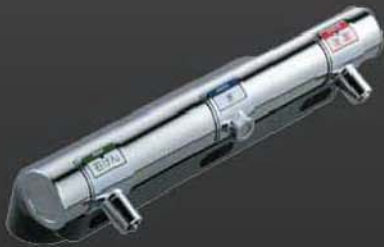
SAWS-B3 SN สามารถจ่ายสบู่เหลว น้ำยาฆ่าเชื้อโรค ได้ไม่เหมือนตัวอื่น