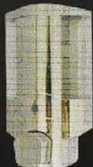
SSV6301 ขนาด 330 มล.