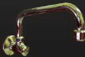
SSF-101 (ก๊อกน้ำแบบกดอัตโนมัติ)